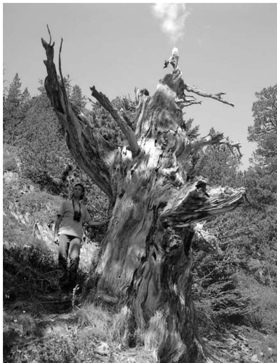
Joost aan de restanten van een eeuwenoude boom