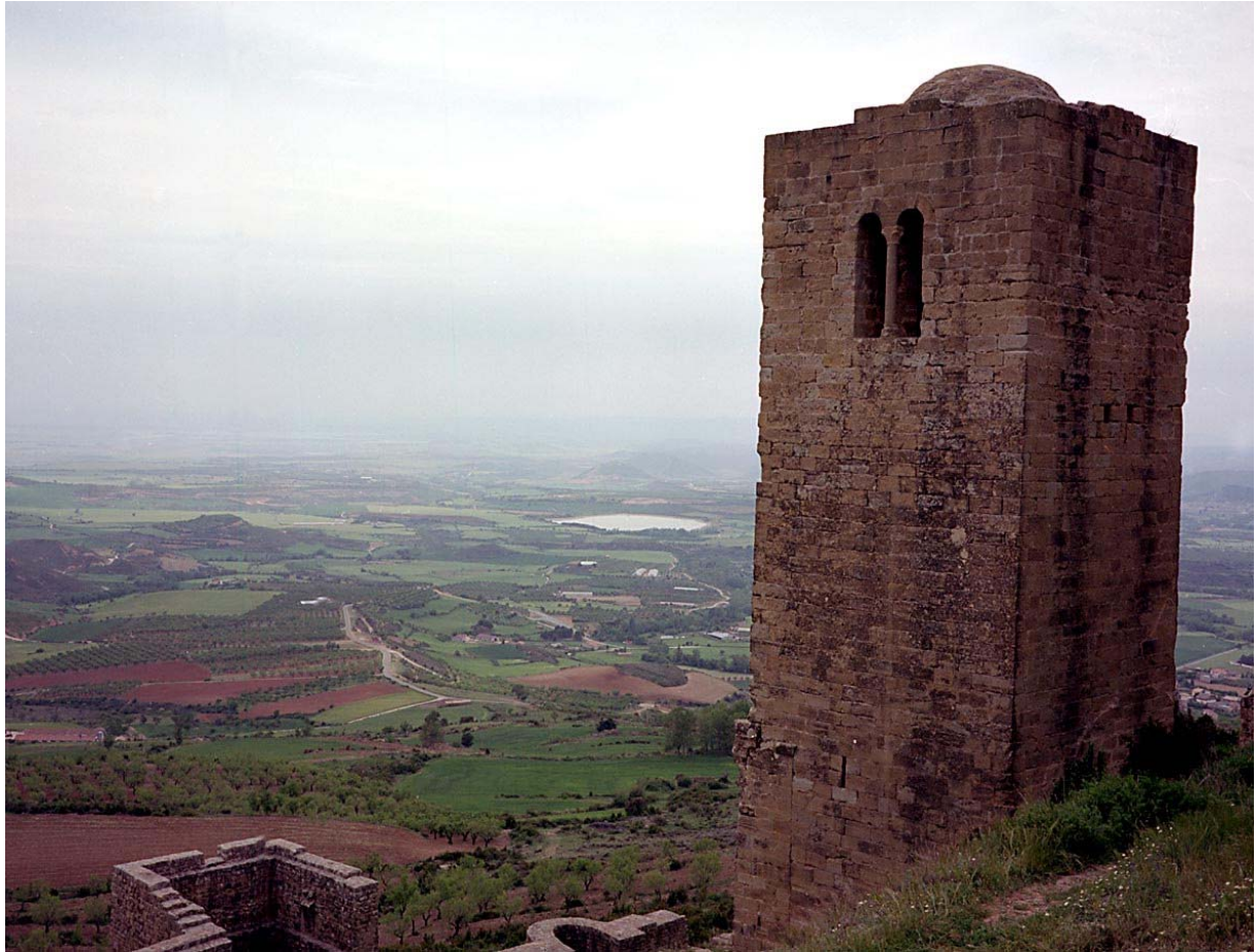
Zicht op Ebrovlakte vanuit het kasteel van Loarre

Op de rots boven Agüero wordt niet geklommen, hier maken we een namiddagwandeling volledig rond de rots, waarbij we de enige (een paar) havikarenden van de reis zien.