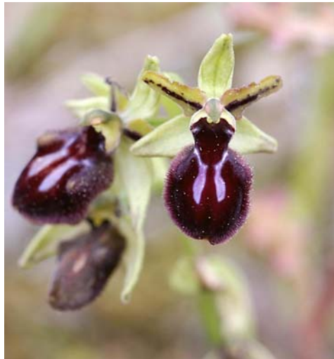
Ophrys sphegodes (Spinnenorchis)

We vertrekken rond 10 uur in Sint-Amands en een uurtje aanschuiven aan een péage zorgt ervoor dat we pas na tweeën voorbij Parijs geraken. Frankrijk blijkt veel groter dan verwacht en om 6 uur kijken we op de kaart om een geschikte kampeerplek te vinden. Het île de Ré aan de Atlantische kust bij La Rochelle lijkt wel geschikt en dat is het ook. Het lijkt wel een waddeneiland met mediterrane invloeden. Op weg naar het eiland rijden we door de Marais de Poitevin en over de futuristische brug tussen het vasteland en het île de Ré. We kamperen op de gemeentelijke camping "Bel-air" van la Flotte. Onze helden de de Keersmakers waren nu al in een Spaans dorpje op zoek naar lammergieren - wij zitten op een eiland halverwege Frankrijk! Aan de jachthaven van La Flotte gaan we bij de plaatselijke Italiaan eten en drinken een pintje in het plaatselijke Baskische café.