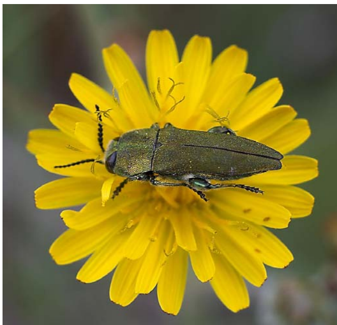
De prachtkever Anthaxia hungarica