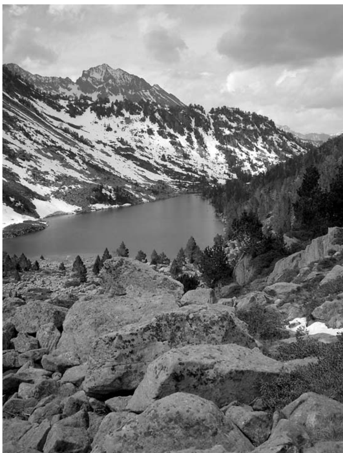
Zicht op het Lac d'Aumar

Zoogdieren: Hermelijn jagend in de sneeuw op ongeveer 2100 m hoogte (zomervacht), Marmotten.