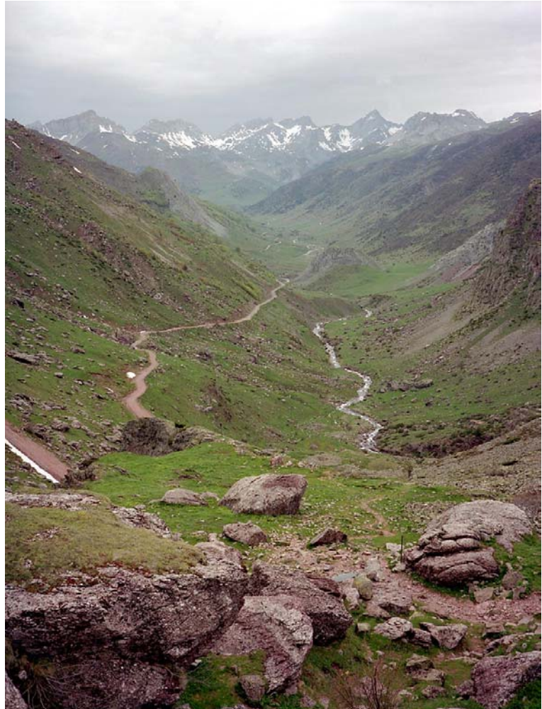
Zicht op de vallei van de Echo

Waar de weg stopt, ter hoogte van Presa Vertedera, beginnen we aan een wandeling door de Echovallei . Zo komen we voor het eerst deze reis in een gebied met alpiene vegetatie. We stijgen langs het pad tot aan de berghut (aan Puento d'os Chitanos). Een rode rotslijster toont zich op zijn mooist, ook hier zien we nog regelmatig lammergieren en ook steenarend. We zien mooi enkele roepende marmotten en een groepje gemzen. Voorbij de berghut strekt zich een vlakke vallei uit waardoor de bovenloop van de Aragon slingert.