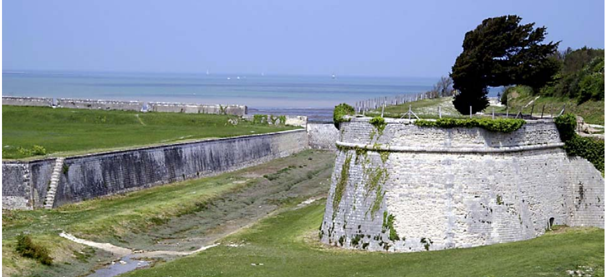
De oude omwalling van St-Martin-de-Ré