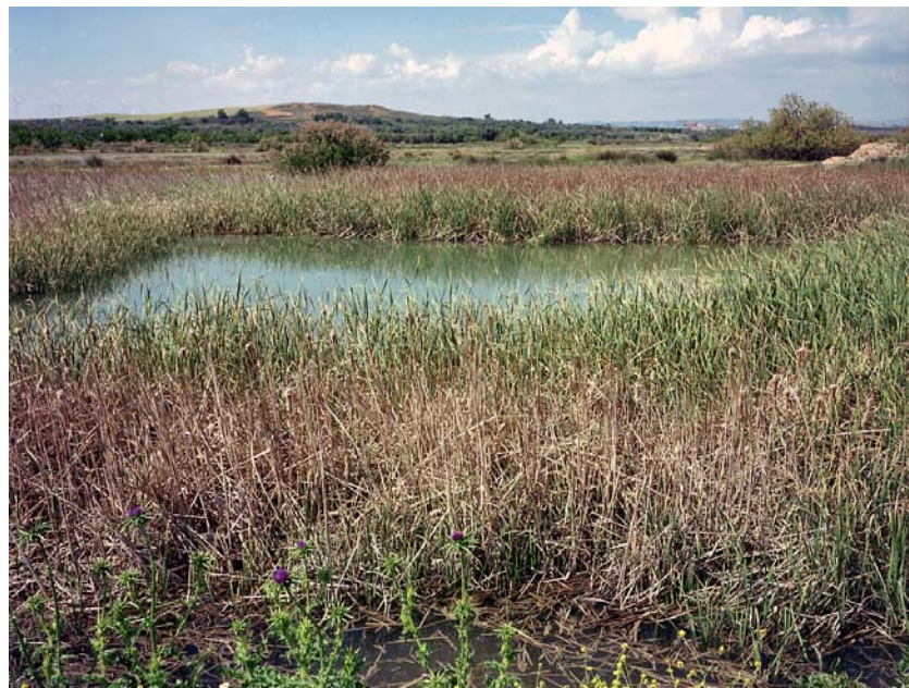
Steppemeertje bij Belchite