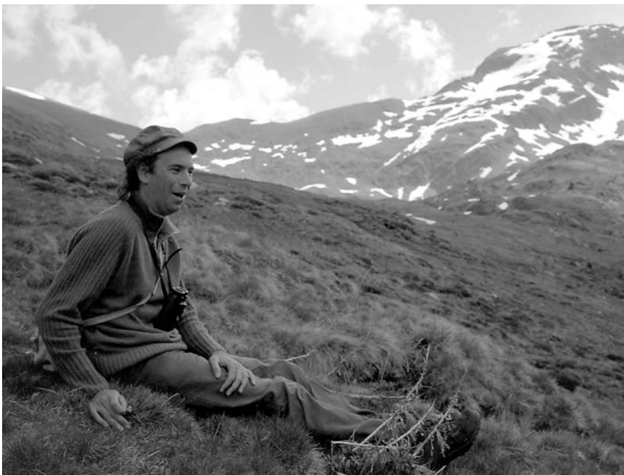
Onze trouwe sherpa