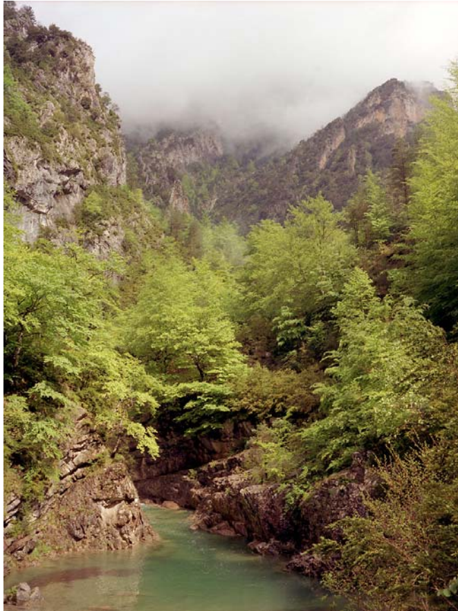
De Rio Bellos in de Cañon de Anisclo