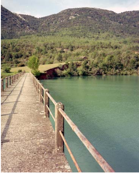
Embalse de la Peña