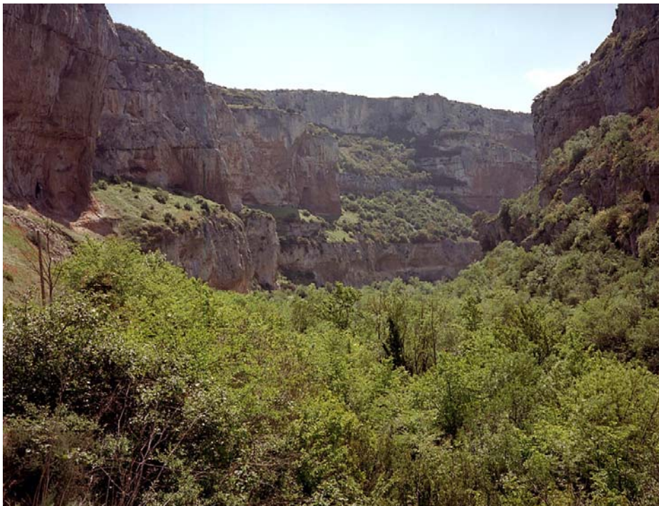
Foz de Lumbier