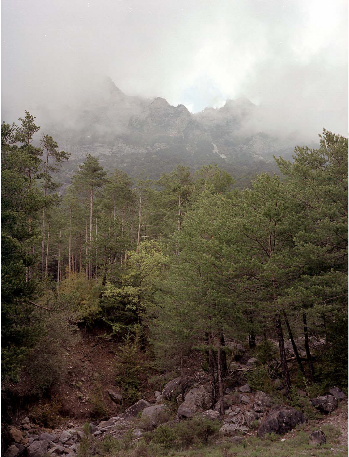
De Peña Solana bij Ceresa

Pas terug aan de auto breekt er een waanzinnig onweer los. De regen valt bij bakken en de donder rommelt onophoudelijk, het wordt zelfs donker en we zien geen steek meer. We wachten een tijdje op beter weer in een hotel-bar-restaurant. Als we de tent opzetten in Puyarruego houdt het even op met regenen, maar daarna begint het terug, gelukkig is er een afdak waaronder we kunnen koken.