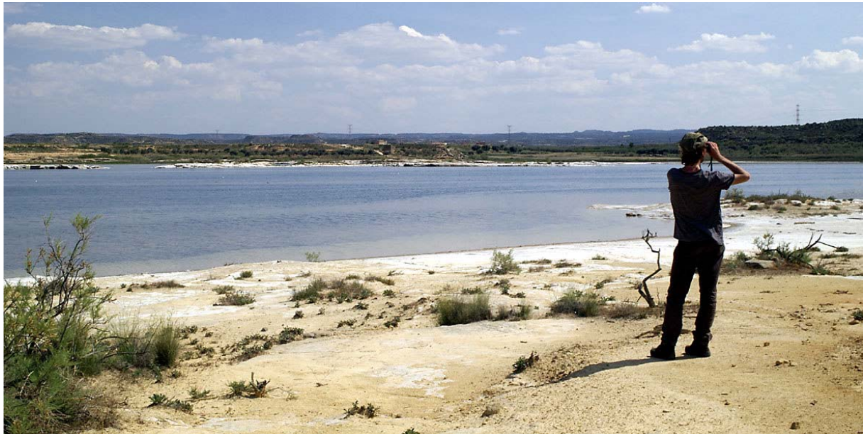
Laguna Salada bij Chiprana

's Avonds zetten we de tent op een camping in Mequinenza , waar de Rio Cinca in de Ebro uitmondt. Voor we gaan eten bezoeken we nog een enorme reigerkolonie langs de Cinca, met vooral zeer veel koereigers, die in groepen af en aan vliegen langs de Cinca. Het stuwmeer aan de monding van de Cinca is blijkbaar van heinde en verre gekend voor zijn grote meervallen, we zien hier zelfs vissers uit de Baltische Staten.