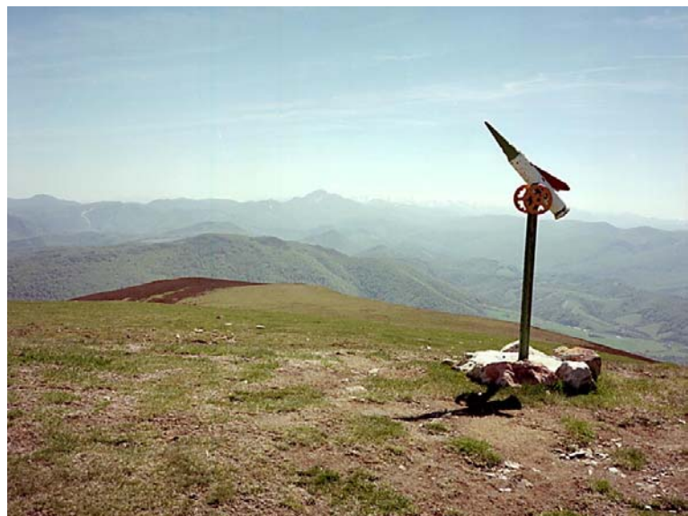
Zicht vanop de Orzanzurieta

De wandelpaden van onze kaart blijken slecht te vinden en op goed geluk dalen we door de mooie beukenbossen af in de richting van de abdij. Ondanks de vele geschikt lijkende oude beuken blijven de verhoopte witruispechten stil. Beneden aan de helling, aan het beekje Patxaranberro, vinden we terug enkele wandelwegen. Een wilde kat steekt haastig het pad over, maar tot onze grote verbazing is het dier niet in de vegetatie verdwenen en kunnen we het van op een tiental meter afstand nog prachtig bekijken. Even verder komen we steeds meer dagjestoeristen en pelgrims