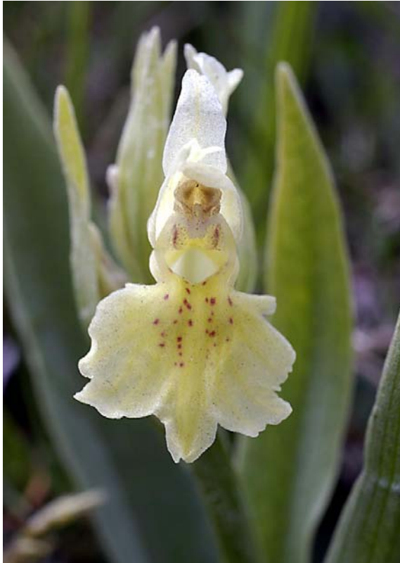
Dactylorhiza sambucina (gele vorm)