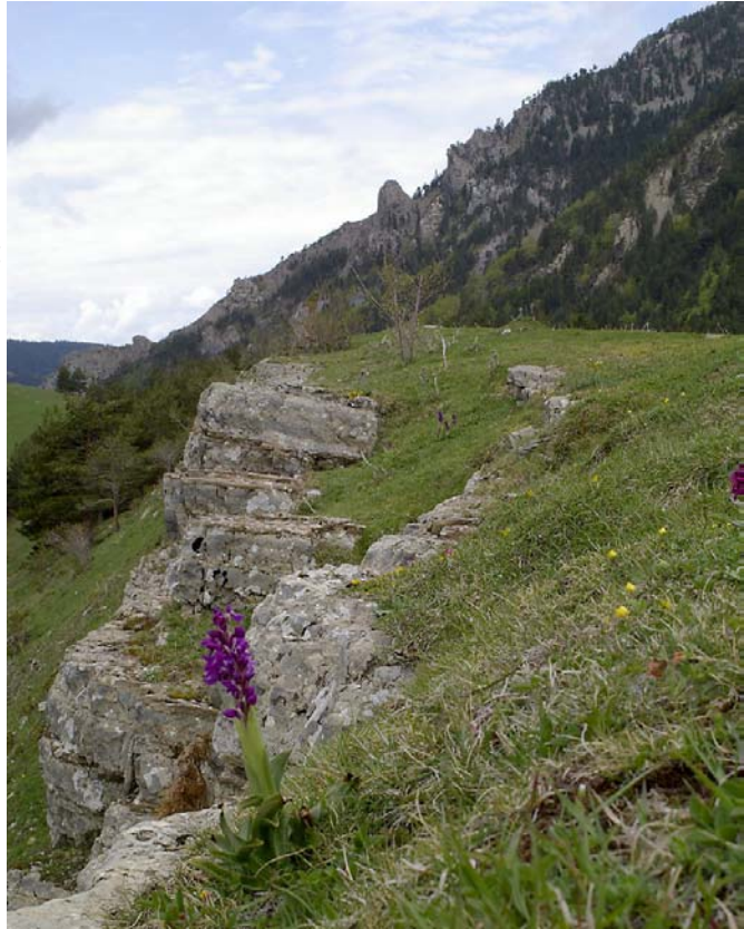
De alpenweiden boven Aragües del Puerto

Via Zaragoza rijden we zo naar de steppen van Belchite . 's Avonds koken we in de steppe, terwijl de krekels, grielen en steenuiltjes beginnen te roepen en er regelmatig witbuikzandhoenen over vliegen. Als het bijna donker is horen we de geheimzinnige zang van de duponts leeuwerik.