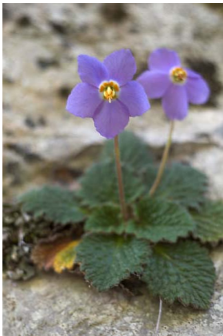
Valle de Anisclo