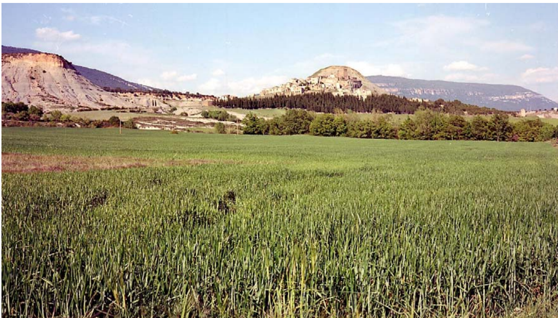
Het dorpje Esco aan het Embalse de Yesa

Amfibieën : Vroedmeesterpad ('s avonds op kampplaats aan rio Aragon)