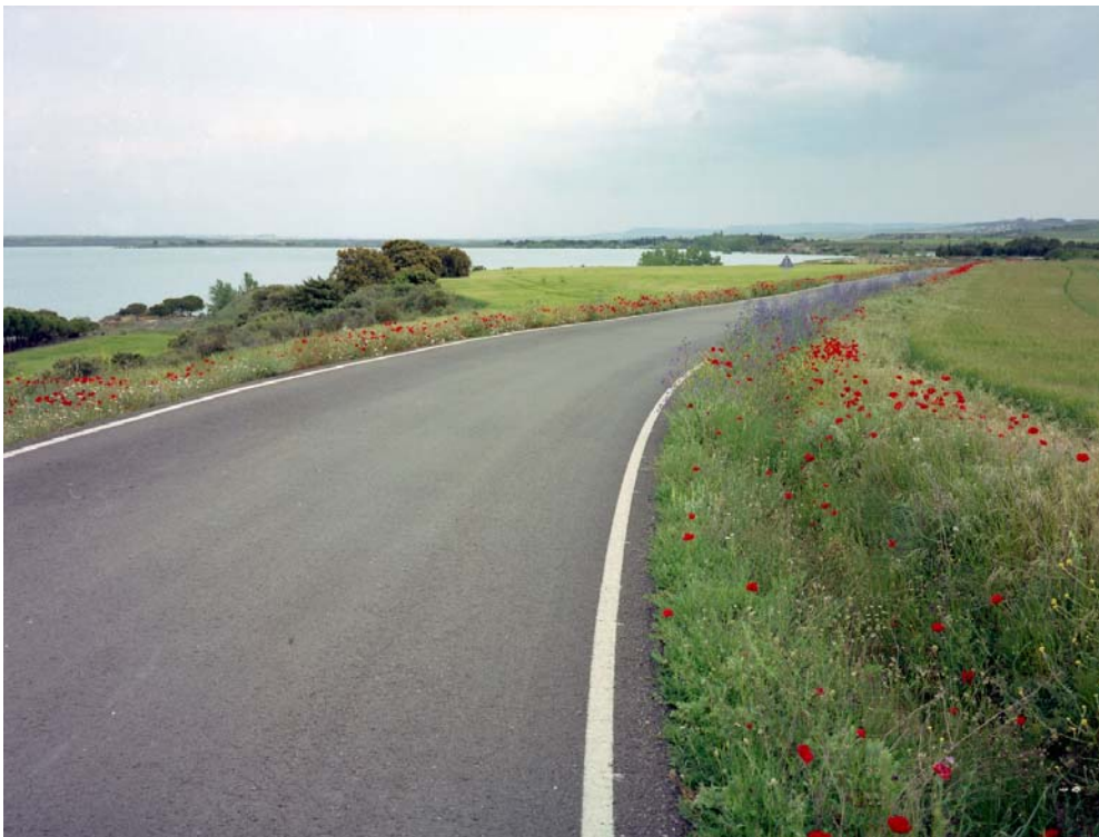
Embalse de Sotonera