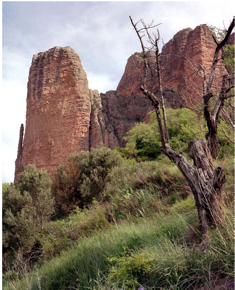
De zandsteenrotsen van Riglos

Planten: Pisum sativum, Orobanche hederæ, Lathyrus cicera, Lathyrus setifolius