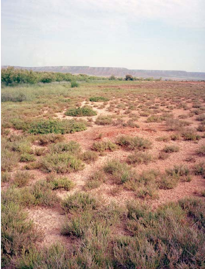
Steppe van Belchite