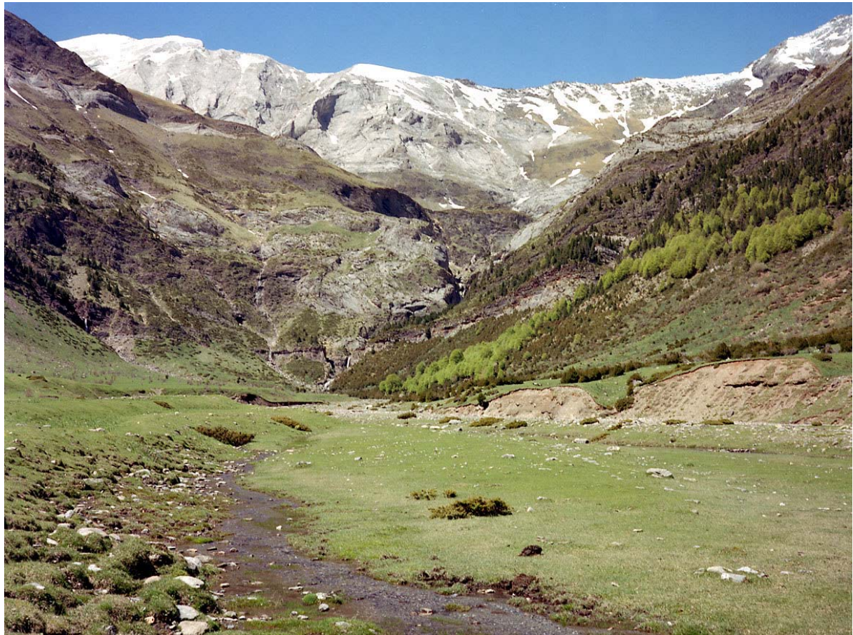
Zicht over de Valle de Pineta