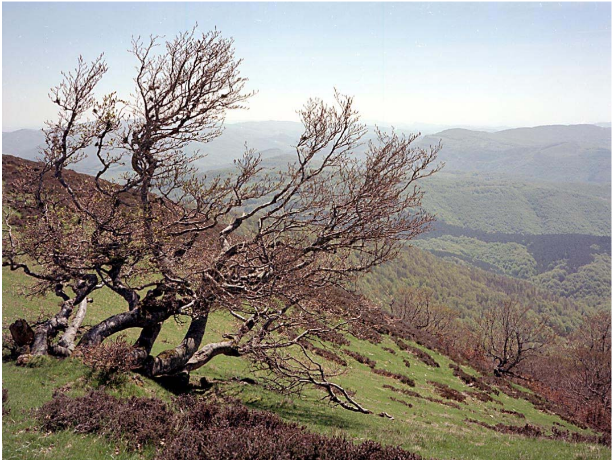
Zicht vanop de Orzanzurieta