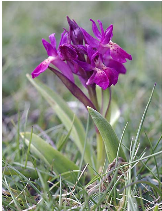
Dactylorhiza sambucina (paarse vorm)