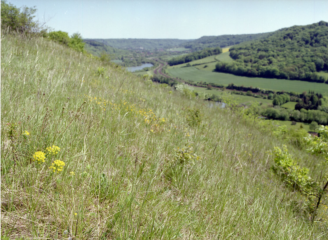
Kalkhelling "Le Rudemont"