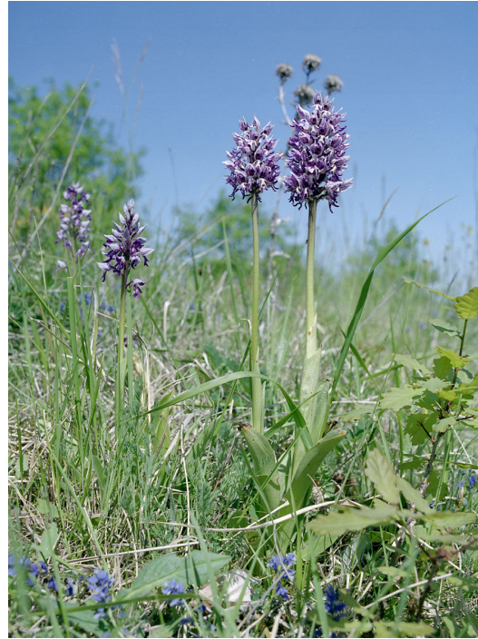
Soldaatje & Aapjesorchis